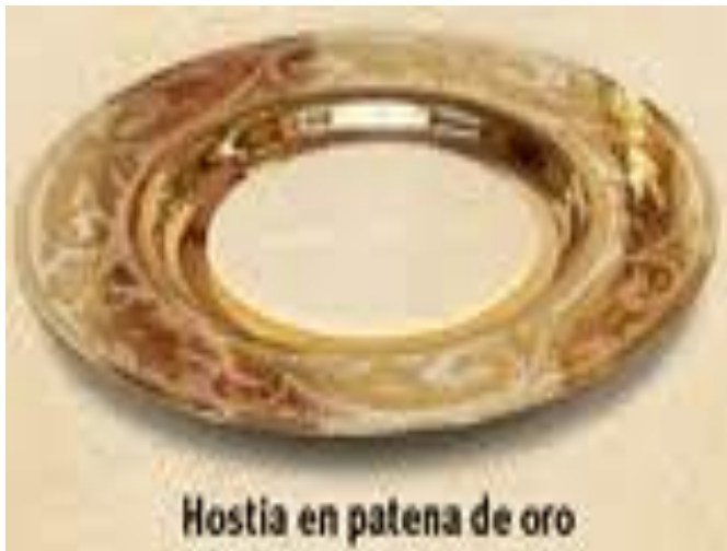
Hostia en patena de oro

Je to miska, na ktorú sa kladie veľká hostia