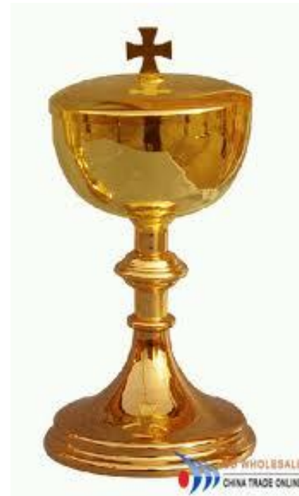
WHOLESALE CHINA TRADE ONLINE

V nej sa vo svätostánku uchováva Eucharistia